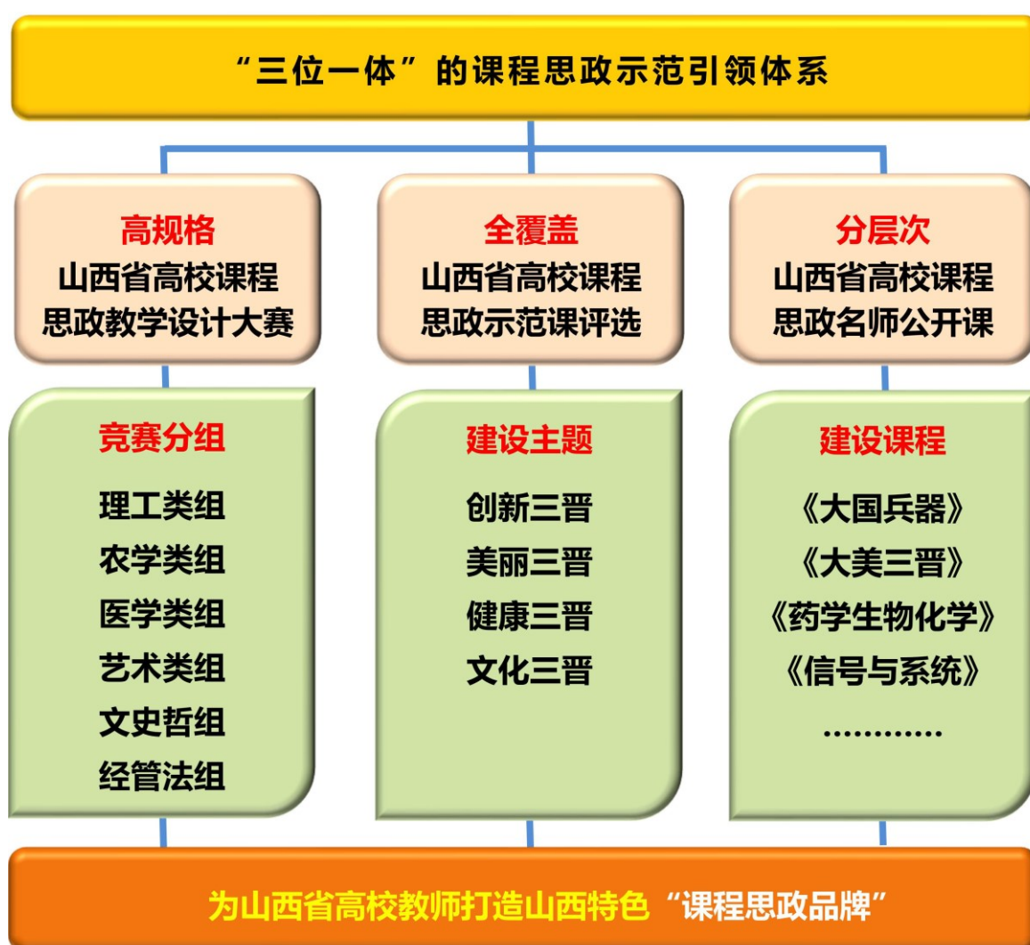
图 4 “三位一体”的课程思政示范引领体系

依托山西省高校课程思政建设联盟，通过“高规格的课程思政教学设计大赛+全覆盖的课程思政示范课评选+分层次的课程思政名师公开课”，构建形成“三位一体”的课程思政建设示范引领体系，打造了山西特色“课程思政品牌”。