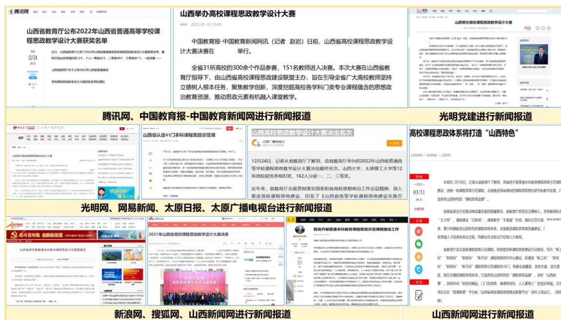
图2 主流媒体对教学成果和经验做法的报道

该成果通过“成立山西省高校课程思政建设联盟，打造‘辐射全省’的 课程思政交流研讨平台 ”，“构建高规格、全覆盖、分层次的激励机制，打造‘三位一体’的 课程思政示范引领体系 ”，“建设模块化、动态化、数字化网络阵地，打造‘开放共享’的 课程思政教学资源体系 ”，建成了一流的山西省高校课程思政“三环”资源共享体系，得到了主流媒体的宣传报道，起到了良好的示范效应。