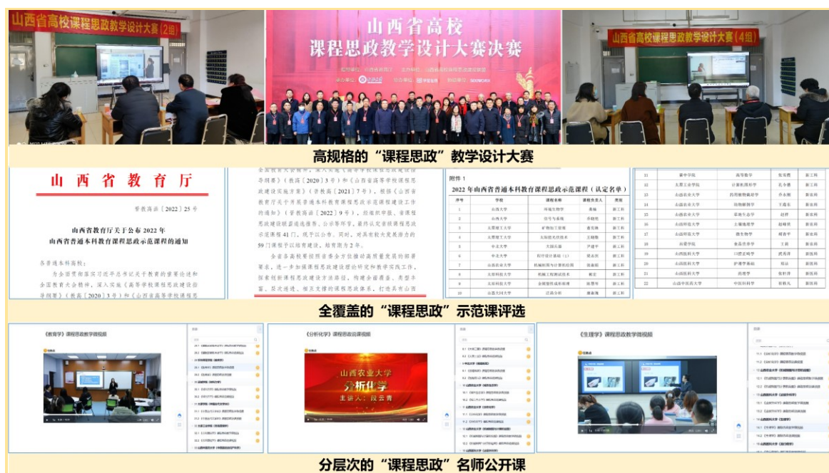
图7 “三位一体”的课程思政示范引领体系

公开课”“三位一体”的课程思政建设示范引领体系，形成了全省“课程思政”建设激励机制。三管齐下促进了教师课程思政能力的显著提升，在2021年和2022年全国高校教师教学创新大赛中，获全国一等奖2项、全国二等奖1项、全国三等奖1项，实现了山西省获全国高校教师教学创新大赛一等奖零的突破。