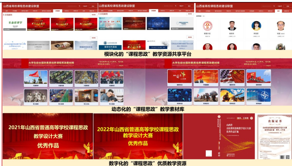
图 8 “开放共享”的课程思政教学资源体系