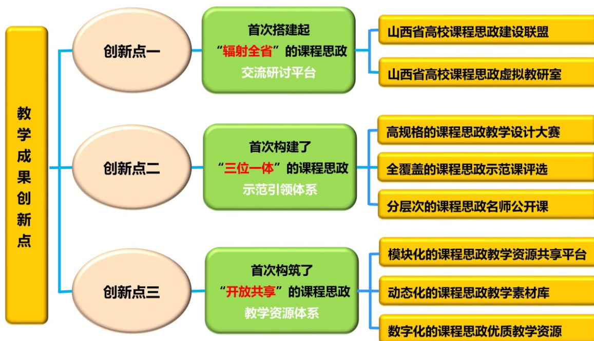
图6 一流课程思政“三环”资源共享体系教学成果创新点

该成果以有效提升教师课程思政教学能力为目标，聚焦平台建设、典型引路和共建共享，构建了“辐射全省”的课程思政交流研讨平台、“三位一体”的课程思政示范引领体系和“开放共享”的课程思政教学资源体系，实现了教学改革创新。