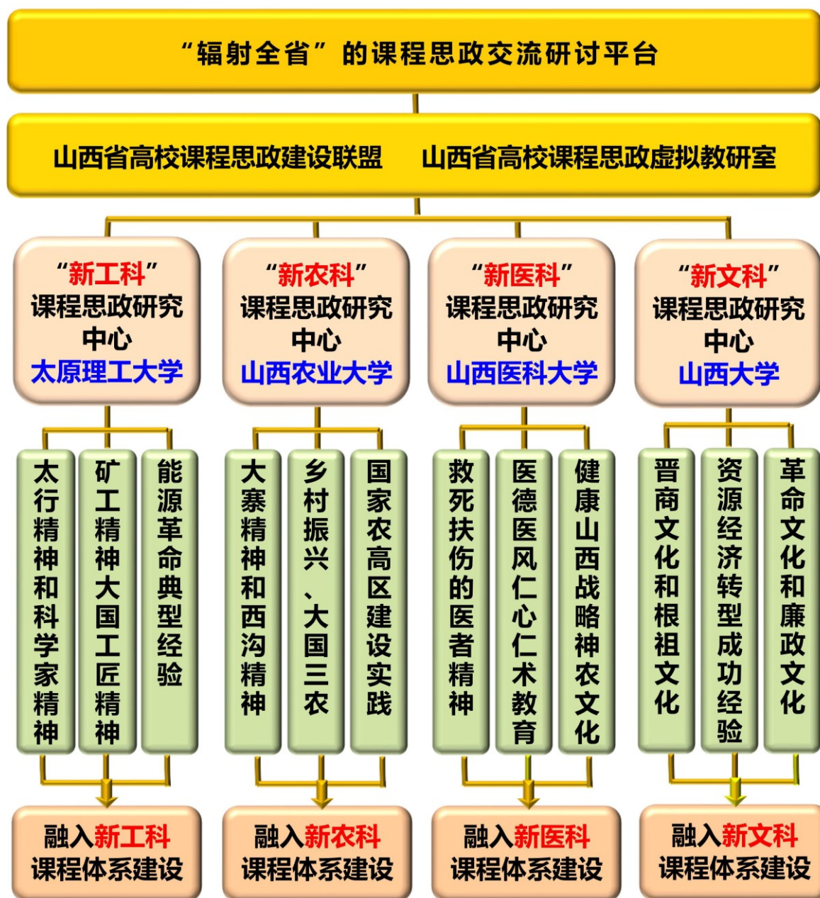
图3 “辐射全省”的课程思政交流研讨平台

1) 由我校牵头，联合省内高校成立了“聚焦四新、共建共享”的山西省高校课程思政建设联盟，设立“新工科”“新农科”“新医科”“新文科”等课程思政研究中心，搭建起我省高校教师课程思政交流研讨平台。