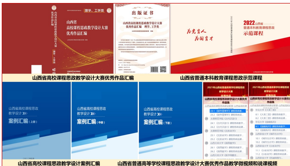
图 10 出版的课程思政优质教学资源（纸质和电子）

该成果培育编写了《山西省高校课程思政教学设计大赛优秀作品汇编（理学、工学类）》，并由高等教育出版社于 2023 年 8 月正式出版。该著作收录了 2021 年山西省普通高等学校课程思政教学设计大赛中 13 所高校获奖的 22 个理学、工学类优秀作品，每个作品包括课程思政教学设计、教学微视频、决赛现场视频。该书的出版对普通高等学校全面落实立德树人根本任务，推进习近平新时代中国特色社会主义思想进课程进教材，促进普通高等学校开展课程思政教学比赛和教学研究，具有较高的参考价值和指导意义。